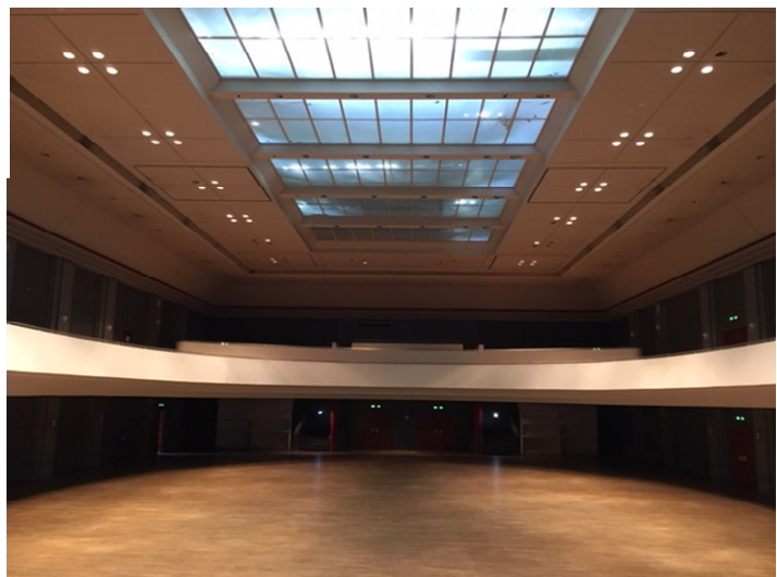
Theatersaal inkl. Galerie