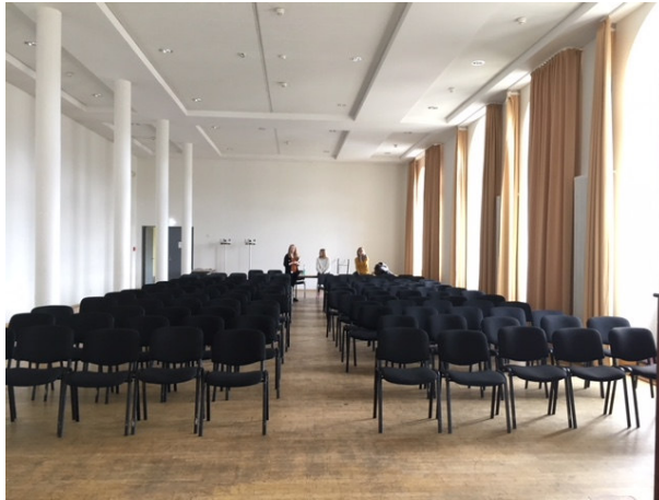
Balkonsaal im Obergeschoss