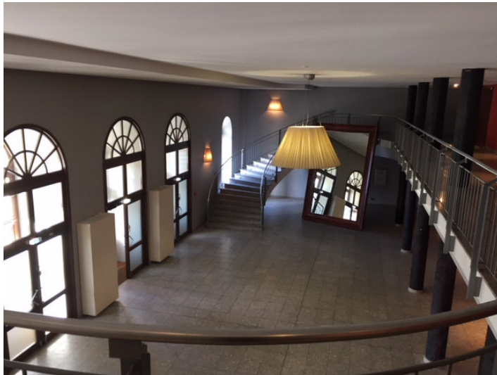
Blick ins Foyer aus der Zwischenetage